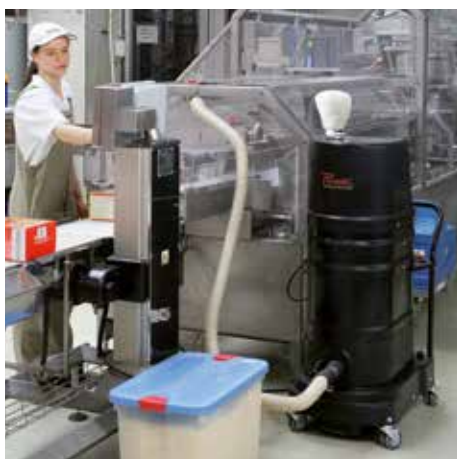
R01 R022 výbuch prachu vo výrobe potravín