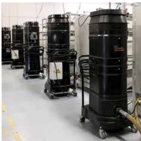
R01 R040 vo výrobe dosiek plošných spojov