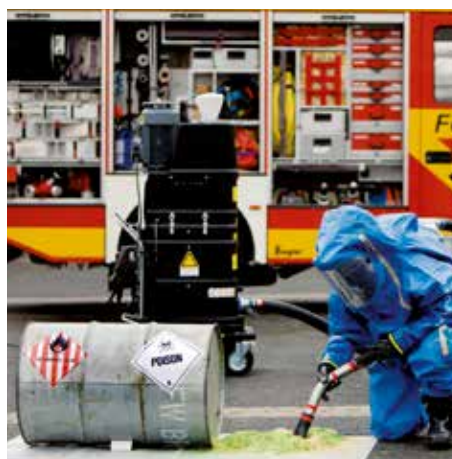
R01 R040 výbuch plynu pri požiarnej ochrane