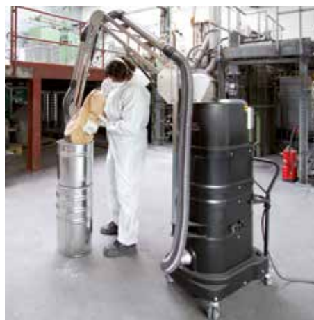
R01 R075 Staub-Ex, s odsávacím ramenom pri výrobe plastov