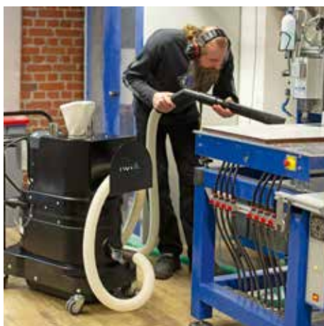
R01 R022 výbuch prachu pri spracovaní dreva