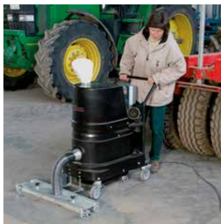
R01 R022 výbuch prachu so zariadením na odsávanie pôdy v poľnohospodárskom priemysle