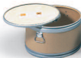
Afvahouder met deksel