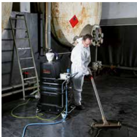
R01 P022 oblast s nebezpečím výbuchu plynu