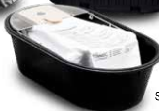
Sáček s prachovým filtrem