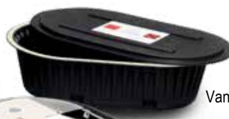
Vana na odpad s víkem