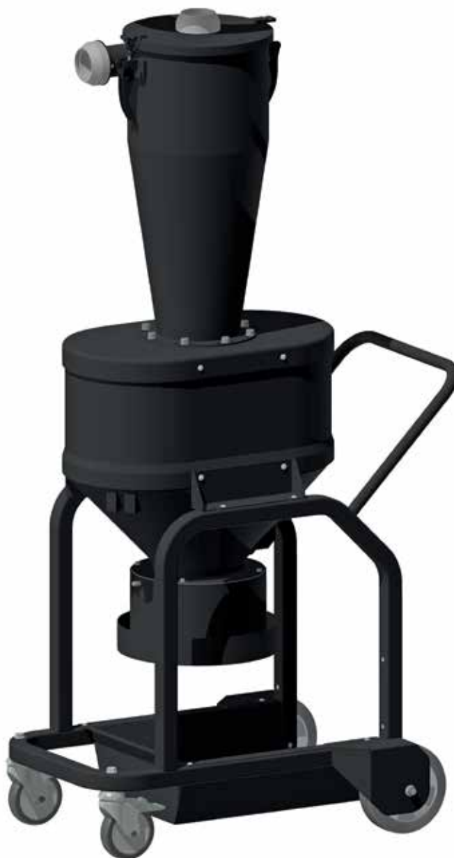
Cyklon s výpustí pro Longopac®