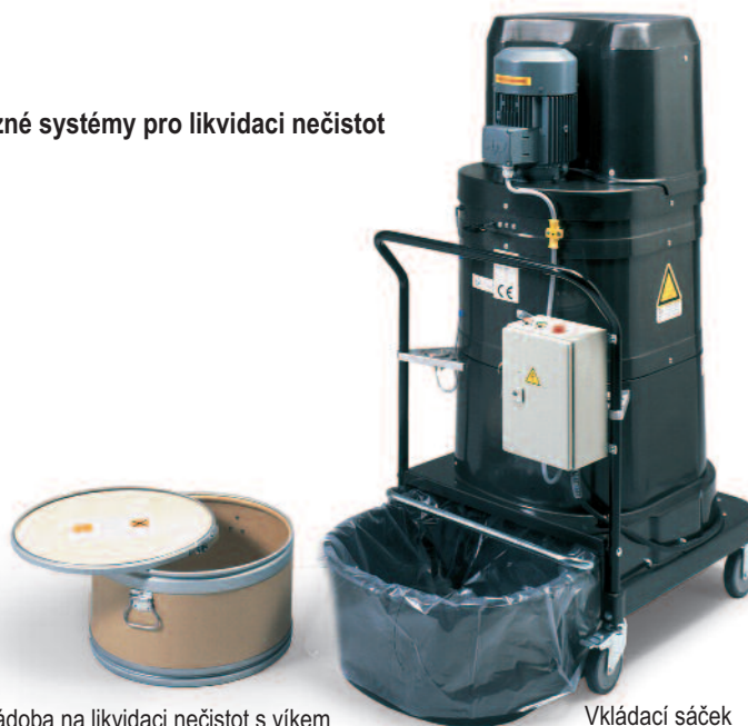
Nádoba na likvidaci nečistot s víkem